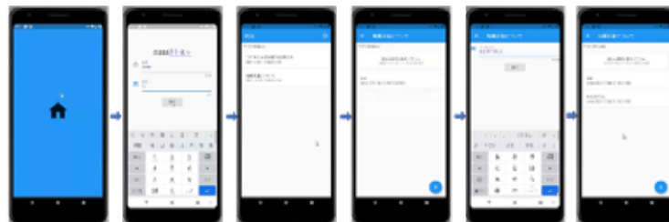
図5 防災アプリの画面構成案

1: ホーム画面が表示される。 → 2: クラス、氏名、出席番号をチャット部屋に入力する。 → 3: 危機別のチャット部屋が表示される。 → 4: 発生した危機別にチャットを行う。(今回は地震災害) → 5: 自分の安否など、メッセージを送信する。 → 6: 各危機のチャット部屋にメッセージが送信される。