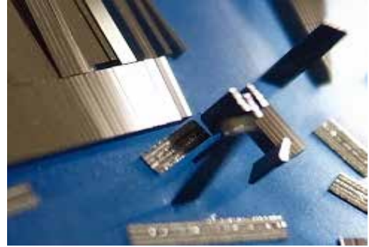
図4. SDにより切り出した大量のTEM用短冊小片

図4はレーザー掃引後のSiウェハである。Y方向の間隔 100\mu\text{m} 対し厚さは4倍の 400\mu\text{m} の高アスペクト比にかかわらず、精度高い大量の自立短冊が形成できた。同様の加工を結晶方位(110)、(111)および各種ドーピングタイプのウェハに対しても歩留まりに若干の差はあるが良好に加工ができた。短冊の側面にはレーザー痕が見受けられるが、その痕跡はイオンビームにより研磨され透過電子顕微鏡試料の観察領域には残留しない事が確認された。本手法を用いれば必要な手作業は試料台への試料貼付けのみとなり、作業効率が飛躍的に向上することを確認した。