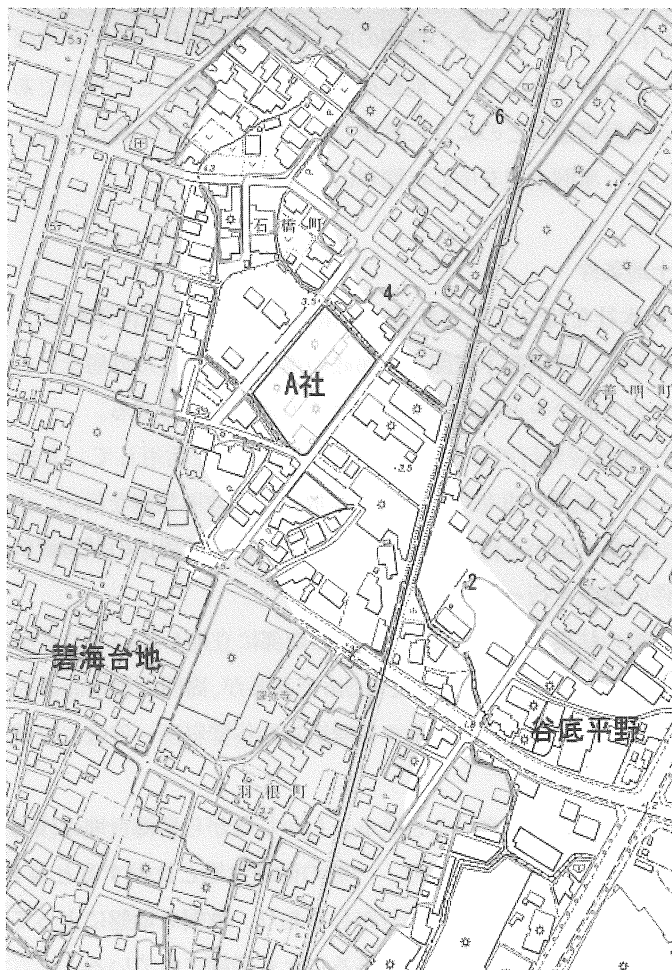
図2 A社周辺の地盤高と詳細地形

今回収集した試錐資料位置は図1に示すが、A社に近接した開析谷中の資料がなかったために（A社では社屋建設当時の試錐資料が残っていなかったため、直接的な地盤情報は不明である）、直接的な評価はやや難しい。